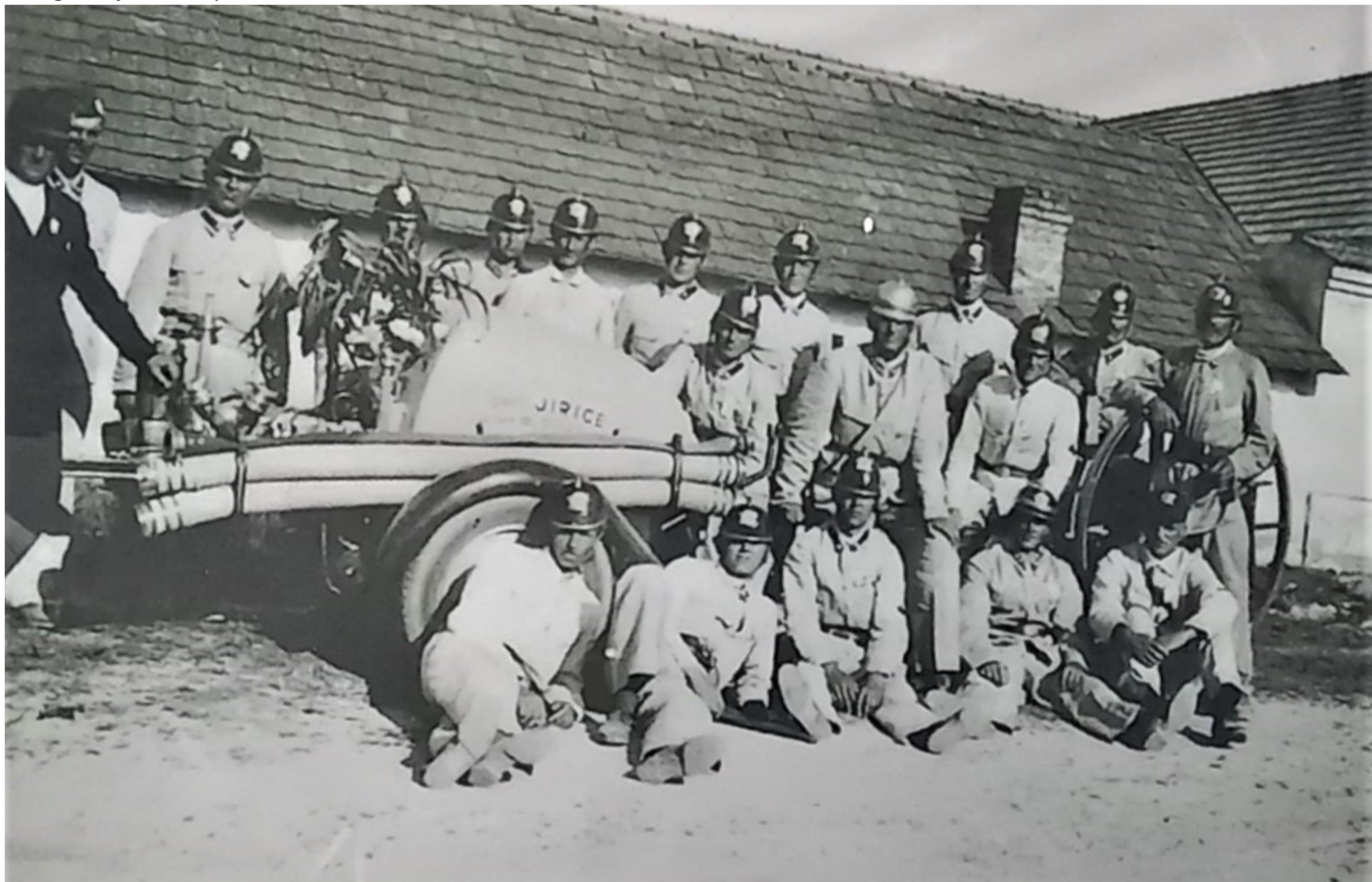
Fotografie jsou z let přibližně 1920-1930