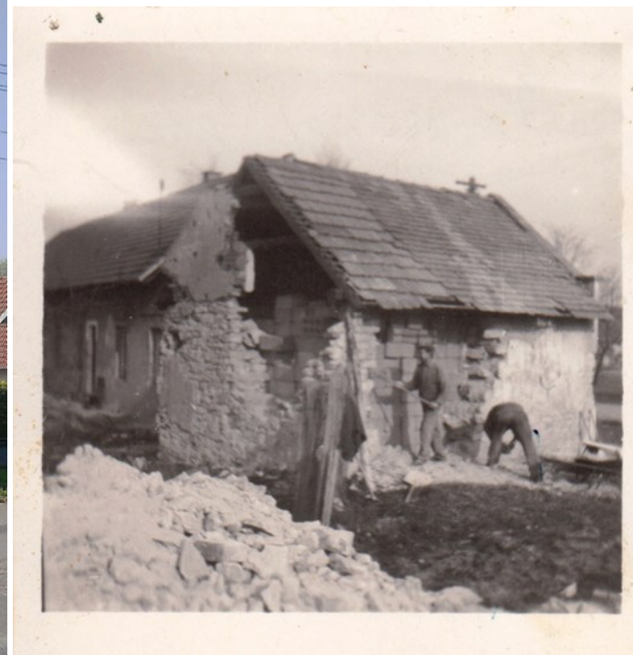
hasičárna krátce po 2.sv.válce