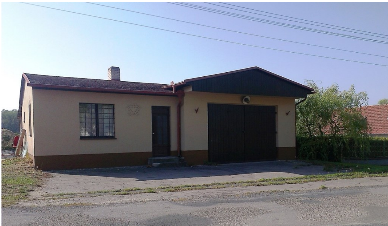
Opravená hasičská zbrojnice rok 2018. Dnes sídlí v jedné části dětský myslivecký spolek